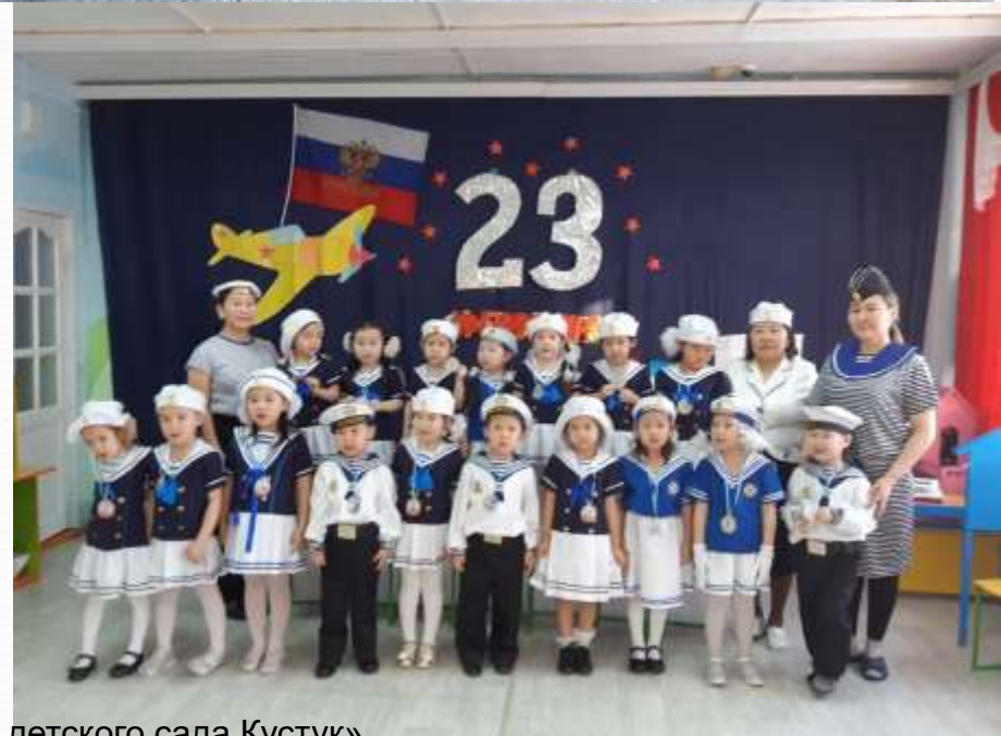
«Космос күнэ», «День Защитников отечества», «Юбилей детского сада Кустук»