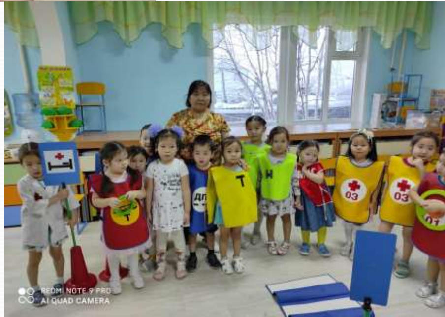
Дьарыктанылар, тематическай тэрээһиннэр