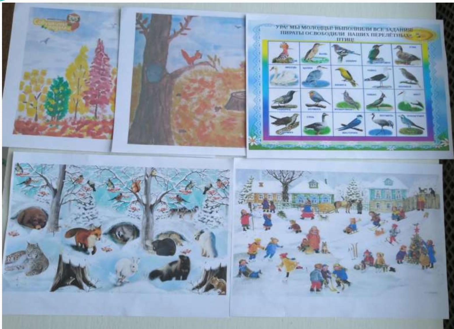
Хартынаны көрөн кәпсээ