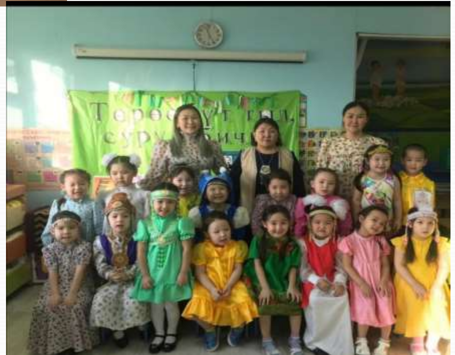
Саха тылын күнэ