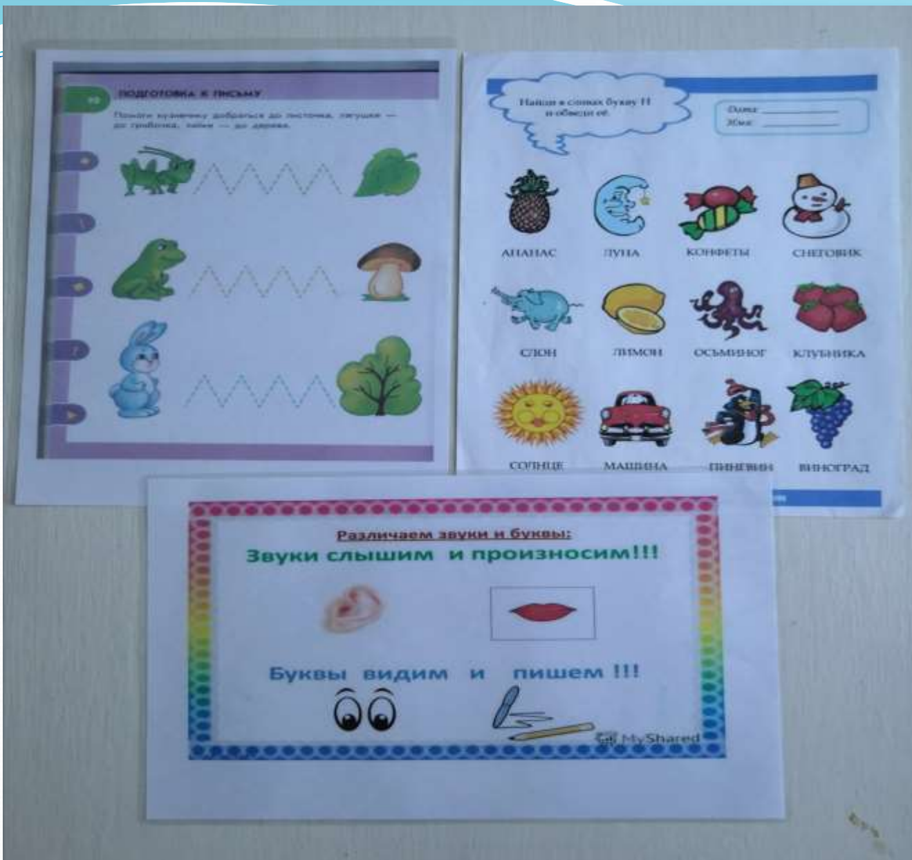
«Аһынкаға көмелес», «Дорџоонно тыллары бул» «Дорџоону истэбит, санарабыт, букваны көрөбүт уонна суруйабыт»