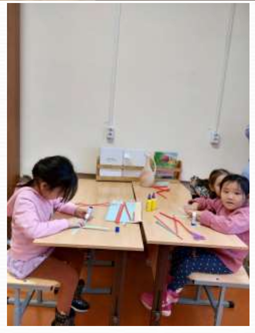
Англискай тъл, шахмат, ай-тик курууоктарыгар