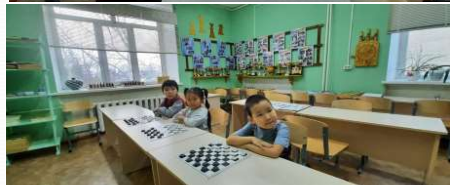
Шашка, робототехника куруууогар