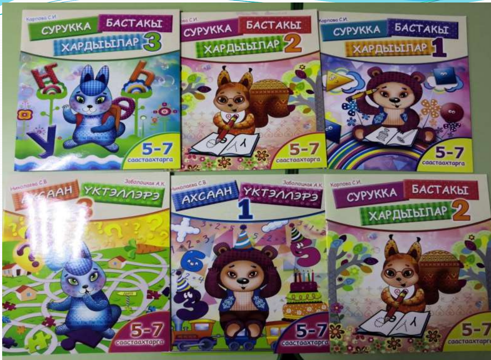
Рабочай тэтэрээттэр:»Сурукка бастакы хардыылар» С,И. Карпова, «Ахсаан үктэллэрэ» Николаева С.В., Заболоцкая А.К.