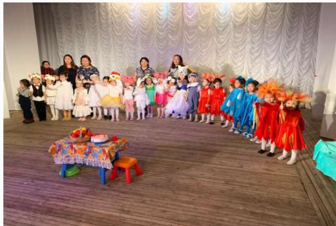
Куонкурустарга, тематической тэрээһиннэргэ кыттабыт