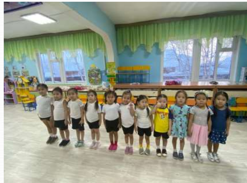
“Наука күнэ”, “Я- лидер” күрэххэ “Албын саһыл” хамсанылаах оонньуу