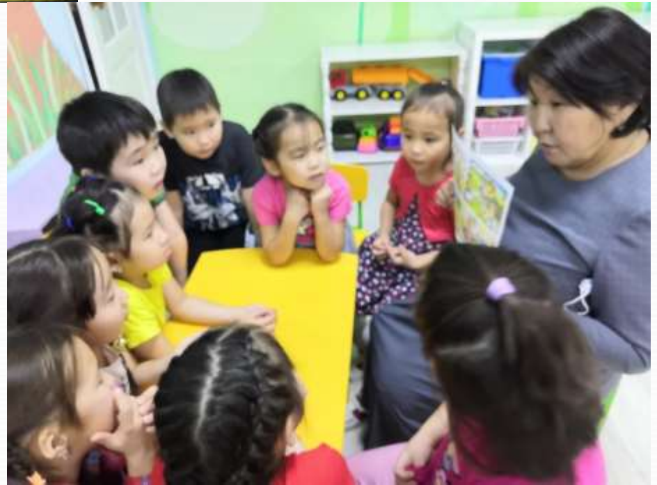
Биирдиилээн, подгруппанан эбии дьарыктар